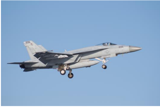
岩国基地の米空母艦載機F A - 1 8 E スーパーホーネット

広島高裁で岩国爆音訴訟の控訴審判決が出ました。爆音の違法性は認められたものの、飛行差し止めまでは認められませんでした。また滑走路が沖合へ移設されたことにより爆音被害は軽減されたとし、機数が増加したこと、空母艦載機やF-35Bステルス戦闘機のエンジン出力が従来機よりも大きくなっていることによる爆音被害の増大も認められませんでした。