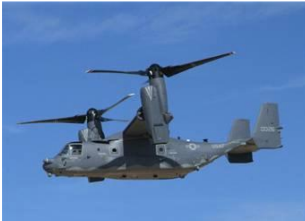
米フロリダ州で墜落した垂直離着陸輸送機 CV-22オスプレイ (MV-22の同型機)

この間、米軍再編に伴う厚木基地空母艦載機部隊の移駐や愛宕山事業跡地への米軍住宅建設のみならず、垂直離着陸輸送機MV-22オスプレイの配備まで強行されようとしています。しかもオスプレイを乗せた運搬船は、既に岩国へ向けて出港しているのです！